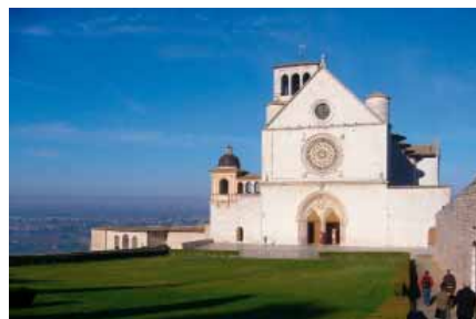
„Ein Sonnenstrahl reicht hin, um viel Dunkel zu erhellen“: Basilika St. Francesco

Mir ist besonders eine Wanderung mit all jenen Orten, die für Franziskus' Werdegang richtungswesend waren, im Gedächtnis geblieben. Zwischen Rivotorto und Portiunkola liegt die kleine Kapelle S. Maria Maddalena. Sie ist aus der Zeit, als es vor den Toren der Stadt noch sogenannte Leprosorien (Aussätzigenheime) gab. Sie erzählt davon, wie Franziskus