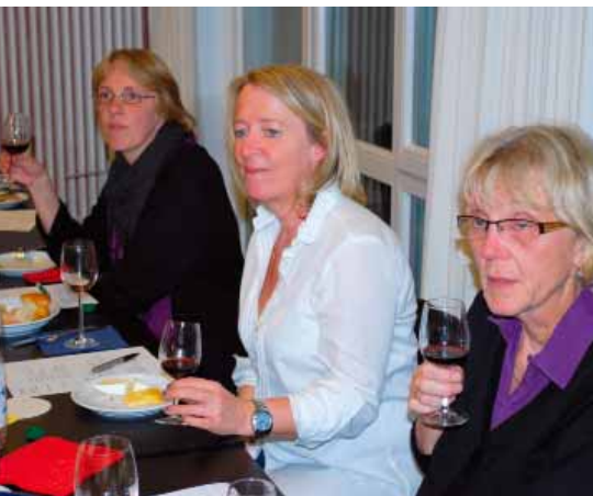
... Mitarbeiterinnen des Johannes-Hospizes, ...